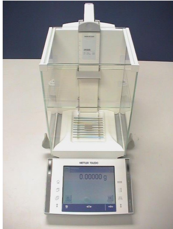
Abbildung 7: Waage zur gravimetrischen Kontrolle der dosierten Volumina.

Die erhaltenen Ist-Konzentrationen können in Kalibrationsdateien für GC-MS- oder LC-MS-Datensysteme exportiert werden.