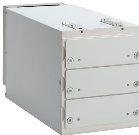
Abbildung 1: Gekühltes Schubladensystem.