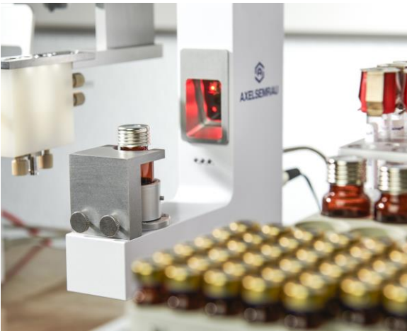
Abbildung 2: 2D-Barcodeleser.