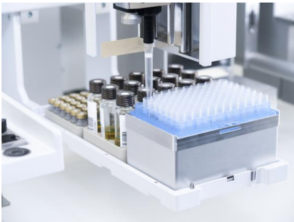
Abbildung 6: Pipettenspitzen für das Liquidhandling der Stammlösungen.

Eine weitere Anforderung an ein System zur Erstellung von Kalibrierstandards, das mit hochkonzentrierten Standards arbeitet, ist die Verhinderung von Verschleppungen. Um jegliche Verschleppung auszuschließen, verwendet die CHRONECT Workstation MultiMix Einmalpipettenspitzen für die Dosierung der Stammlösungen. Diese Pipettenspitzen sind für das jeweils verwendete Lösemittel kalibriert, um möglichst exakt die Zielkonzentration des Analyten zu erreichen. Diese Kalibrierung wird bei der Installation durchgeführt und kann durch einen mitgelieferten Workflow in der Steuerungssoftware jederzeit automatisiert durchgeführt werden.