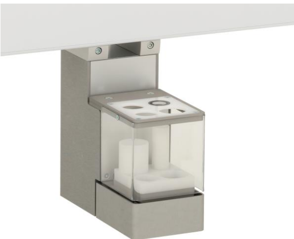
Abbildung 3: Vortex-Mixer.